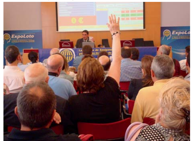
Distintos momentos de ExpoLoto Madrid y Barcelona 2011: charlas, presentaciones, exposición...