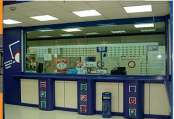
Imagen Corporativa L.A.E.