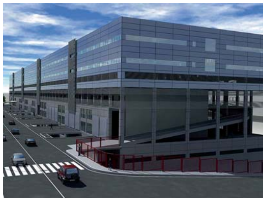
Edificio ALFA III, donde se ubican las nuevas oficinas de ASG.

Además, las nuevas oficinas disponen de una sala multimedia de formación preparada para impartir cursos a 8 personas simultáneamente.