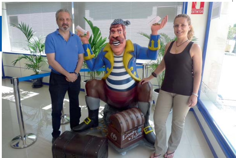
La mascota del Pirata de la Suerte es el alma de esta nueva Administración.

Sin duda, las referencias a la situación actual son constantes y muchos clientes refieren que si fuera de otra manera, jugarían mas, es un mito eso de que en tiempos de crisis se juega más, cuando no hay dinero, no lo hay para nada.