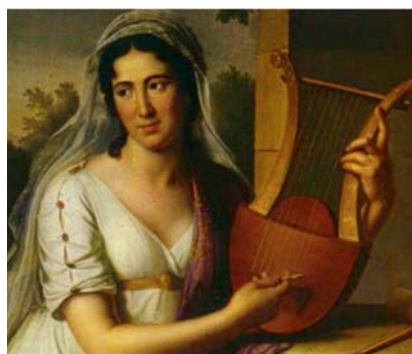
Isabel Colbrand, artista del siglo XIX, da nombre a la calle de las oficinas de ASG.

Además fue también compositora de 4 volúmenes de canciones. Gioachino Rossini la consideró su musa y una de las mejores intérpretes de su obra. ■