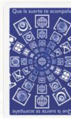
Detalle Parte Trasera Estándar