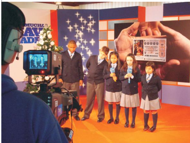
Entrevista para TVE de las Niñas de San Ildefonso que cantaron el Gordo.

Además, de las publicaciones mencionadas Loterías del Estado tiene otros canales de comunicación que dependen de otros departamentos como son: El canal LAE, el programa de “La Suerte en tus Manos” que retransmite la 2 de Televisión Española y la página WEB.