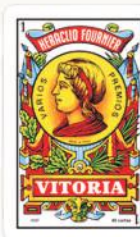
Detalle Parte Delantera