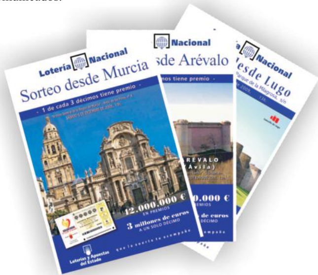
Distintos carteles de los Sorteos Viajeros de la Lotería Nacional.

-La retransmisión de los sorteos por televisión no dependen del Servicio de Comunicación, aunque tenemos una colaboración muy estrecha con todo el personal de televisión, tanto con el equipo que realiza el programa de “La suerte en tus manos”, como con el equipo que retransmite los Sorteos Viajeros. Desde nuestro Servicio se les suministra un dossier para los sorteos de Lotería Nacional, tratándose de un sorteo viajero se les proporciona, además, la información que consideramos adecuado que vaya contando durante la retransmisión del sorteo. Al igual que al resto de medios se les envía todas nuestras notas de prensa y comunicados.